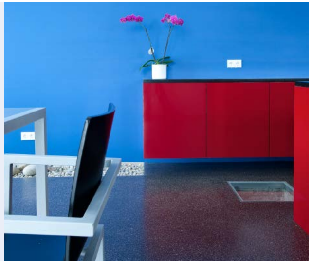
Schwimmender Gussasphaltestrich auf Massivdecke